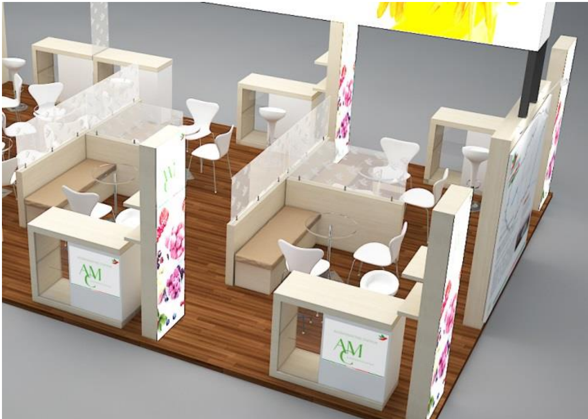
A kép illusztráció.

A magyar vállalatoknak egyenként 9 m 2 -es, saját grafikával és tárgyalófelülettel szeparált standrészt biztosítunk megjelenésükhöz.